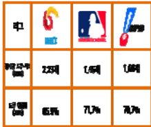
● 기록 출처 : KBO, MLB, NPB